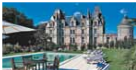
PAYS-DE-LA-LOIRE (49) - CHÂTEAU DE LA TREMBLAYE - 02 41 58 40 17