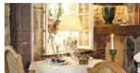
BOURGOGNE (71) MOULIN D'HAUTERIVE - 03 85 91 55 56