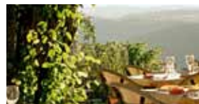
MIDI PYRÉNÉES (46) LES VIEILLES TOURS - 05 65 33 68 01