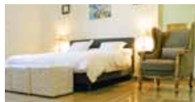
PROVENCE-ALPES-CÔTE-D'AZUR (84) L'A PROPOS - 04 90 34 54 91