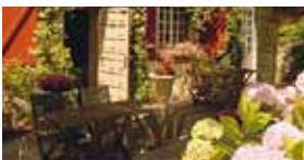
AQUITAINE (64) VILLA CATARIE - 05 59 47 59 00