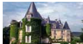
AQUITAINE (24) CHÂTEAU DE LA CÔTE - 05 53 03 70 11