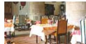
NORMANDIE (50) - L'HOSTELLERIE DU CHÂTEAU - 02 33 52 24 49