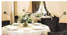
RHÔNE-ALPES (07) HÔTEL HELVIE - 04 75 94 65 85