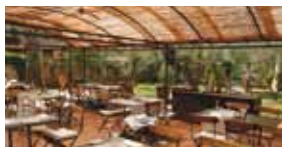
PROVENCE-ALPES-CÔTE-D'AZUR (83) AUBERGE DU PARC - 04 94 59 53 52