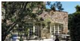
LANGUEDOC-ROUSSILLON (66) - LE RELAIS DES CHARTREUSES - 04 68 83 15 88