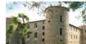
LANGUEDOC-ROUSSILLON (11) - CHÂTEAU DES DUCS DE JOYEUSE - 04 68 74 23 50