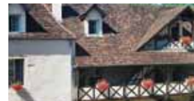
BOURGOGNE (21) HÔTEL WILSON - 03 80 66 82 50