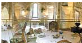
AUVERGNE (03) - DOMAINE CHÂTEAU SAINT-JEAN - 04 70 02 71 71