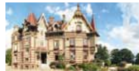
NORMANDIE (27) CHÂTEAU DE LA RAPÉE - 02 32 55 11 61