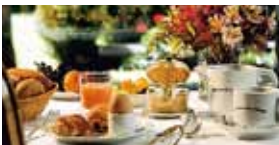
AUVERGNE (15) - HOSTELLERIE DE LA MARONNE - 04 71 69 20 33