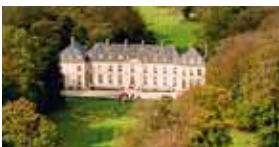
NORMANDIE (76) - CHÂTEAU DE SISSI - 02 35 28 00 11