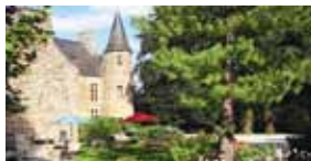
NORMANDIE (50) - CHÂTEAU D'AGNEAUX - 02 33 57 65 88