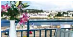
BRETAGNE (29) LE GOYEN - 02 98 70 08 88