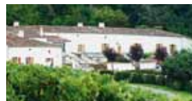
POITOU-CHARENTES (16) - LE RELAIS DE SAINT-PREUIL - 05 45 80 80 08