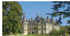
CENTRE (37) - CHÂTEAU DE LA BOURDAISIÈRE - 02 47 45 16 31