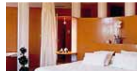
POITOU-CHARENTES (86) - LES LOGES DU PARC - 05 49 19 40 50