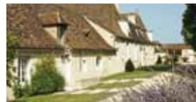
AQUITAINE (24) - LA CHARTREUSE DU BIGNAC - 05 53 22 12 80