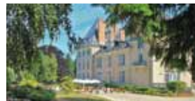
BRETAGNE (22) CHÂTEAU LE WINDSOR - 02 96 83 04 83