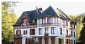
NORMANDIE (61) - BOIS JOLI - 02 33 37 92 77