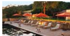
BOURGOGNE (21) - CHÂTEAU DE COURBAN & SPA - 03 80 93 78 69