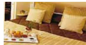
BOURGOGNE (71) - HOSTELLERIE BOURGUIGNONNE - 03 85 91 51 45