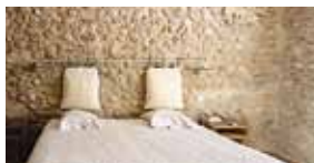
LANGUEDOC-ROUSSILLON (30) LA BASTIDE DES SENTEURS - 04 66 60 24 45