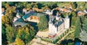
AUVERGNE (03) CHÂTEAU DE BUSSET - 04 70 59 13 97