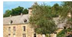
BRETAGNE (22) CHÂTEAU DU VAL - 02 96 32 75 40