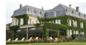
ILE-DE-FRANCE (77) CHÂTEAU DE SANCY - 01 60 25 77 77