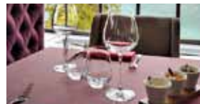
RHÔNE-ALPES (74) PALACE DE MENTHON - 04 50 64 83 00