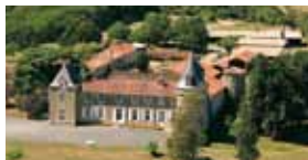
PAYS-DE-LA-LOIRE (85) - MANOIR DE PONSAY - 02 51 46 96 71