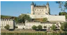
PAYS-DE-LA-LOIRE (49) - ANNE D'ANJOU - 02 41 67 30 30