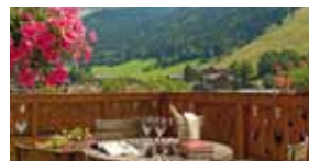
RHÔNE-ALPES (74) HÔTEL CARLINA - 04 50 02 43 48