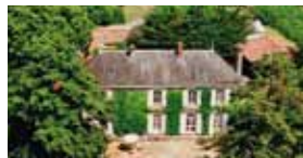
PAYS-DE-LA-LOIRE (85) - CHÂTEAU DE L'ABBAYE - 02 51 56 17 56