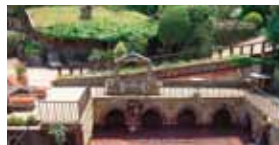
PROVENCE-ALPES-CÔTE-D'AZUR (06) - HÔTEL LA VIGNETTE HAUTE - 04 93 42 20 01