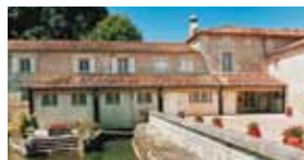
POITOU-CHARENTES (16) - MOULIN DU MAINE BRUN - 05 45 90 83 00