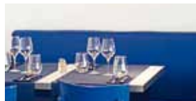
BRETAGNE (29) - HÔTEL ET BISTROT DU BAC - 02 98 56 34 79